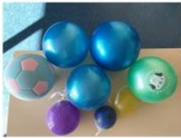
100円均一ショップで入手できるソフトボール (80-130 g)