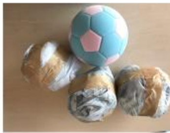
小学校体育サポートで推奨のスポンジボール (200-230 g) および新聞ボール